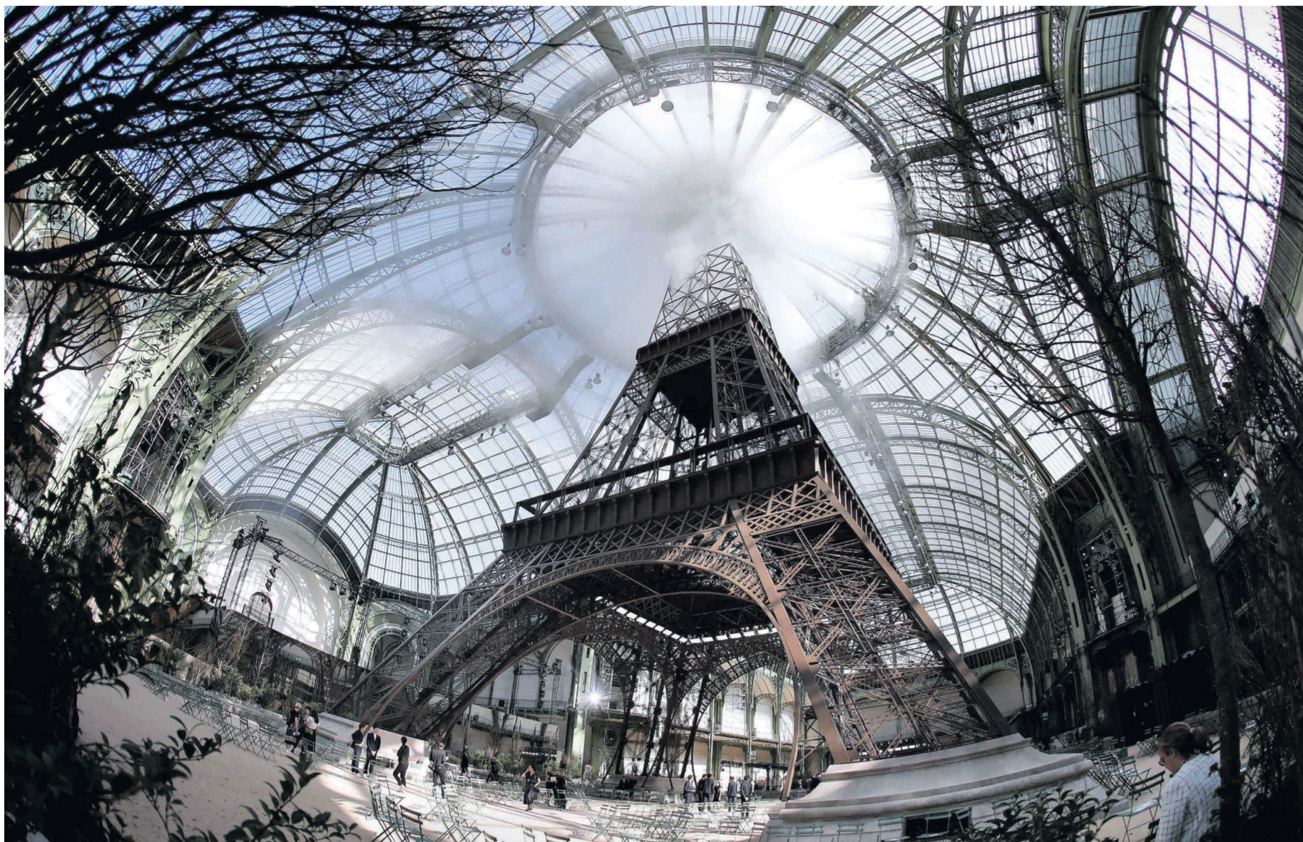
War schon für seinen Erbauer lukrativ und lässt sich seitdem immer wieder verkaufen: Nachbau des Eiffelturms im Grand Palais für eine Haute-Couture-Präsentation